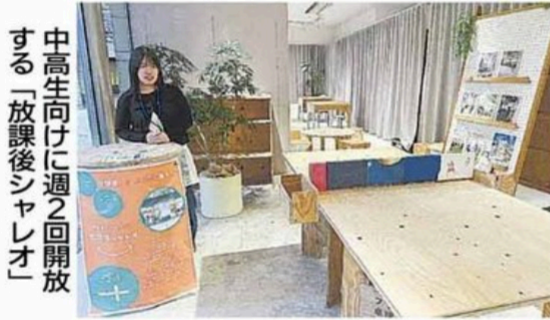
中高生向けに週2回開放する「放課後シャレオ」

が常駐する。市は家庭や学校とは異なる居場所「サードプレイス」としての利用を期待する。シャレオ西通りの区画約90平方メートル。テーブルや